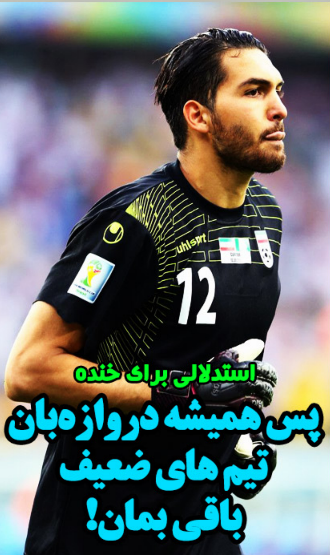
استدلالی برای خنده

رسانه ای برای سبزدلان و هواداران باشگاه ذوب آهن