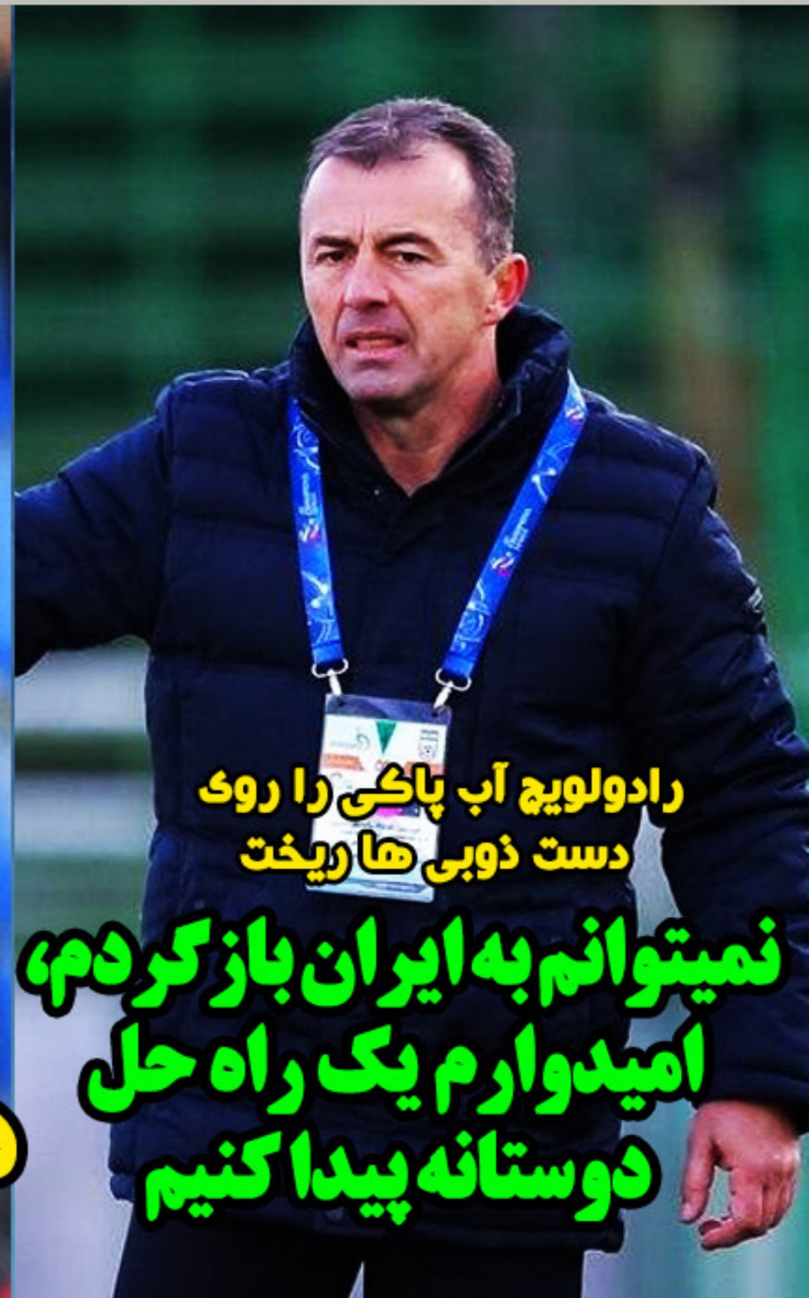
رادولویچ آب پاکی را روی دست ذوبی ها ریخت

نمیتوانم به ایران بازگردم، امیدوارم یک راه حل دوستانه پیدا کنیم