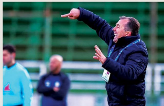
تکلیف رقابت های لیگ برتر به زودی مشخص شود و ما هم آماده هستیم تا با بازگشت سرمربی خود تمرینات را آغاز کنیم.

روی ظرف او درج شده باشد. ظرف ها باید در محل غذاخوری در اختیار بازیکنان قرار بگیرد. هر گروه از بازیکنان زمان مشخصی برای صرف صبحانه در اختیار خواهد داشت. همه بازیکنان نباید با هم در اتاق غذاخوری حضور داشته باشند. شرایط صرف ناهار و شام هم به همین ترتیب خواهد بود. قرنطینه شدن در اتاق ها در باقی ساعات روز در پروتکل مشخص شده بازیکنان تیم ها در ساعاتی از شبانه روز که در حال تمرین نیستند و غذای خود را باید در اتاق های انفرادی خود حضور داشته باشند. این دستورالعمل ریسک ابتلا به ویروس را کاهش داده و با قوانین فاصله گذاری اجتماعی مطابقت دارد. هر نوع تجمع بازیکنان در محوطه های مشترک یا اتاق ها ممنوع است. در هر اتاق باید جعبه های حاوی ماسک و دستکش وجود داشته باشد که بازیکنان بتوانند هر زمان که می خواهند از آنها استفاده کنند. در صورت مثبت شدن یک بازیکن، کل تیم در قرنطینه کامل قرار خواهد گرفت. در پروتکل لالیگا آمده که در چنین شرایطی بازیکنی که به بیماری مبتلا شده باید سریعاً سایر اعضای تیم دور نگه داشته شود و هیچکس با او در ارتباط قرار نگیرد.