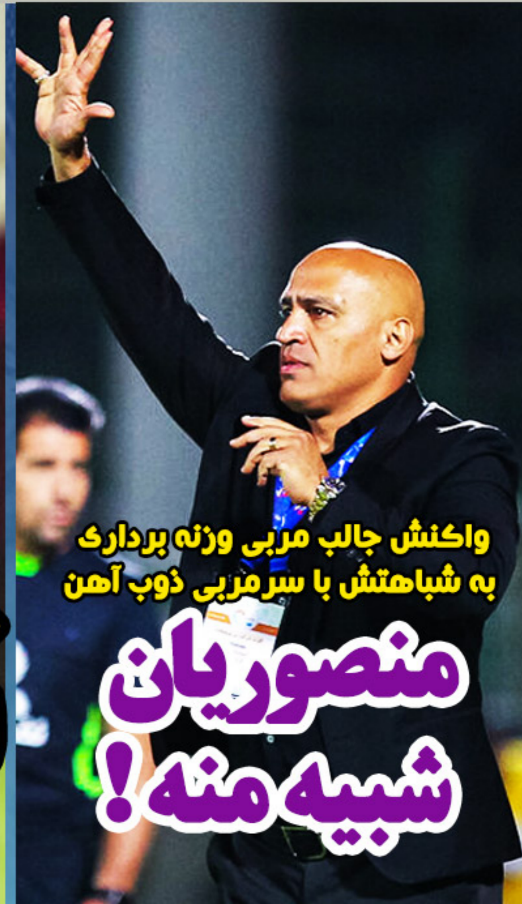
واکنش جالب مربی وزنه برداری به شباهتش با سرمربی ذوب آهن