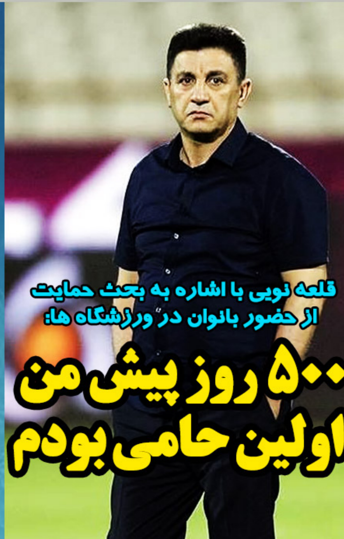
قلعه نویی با اشاره به بحث حمایت از حضور بانوان در ورزشگاه ها: