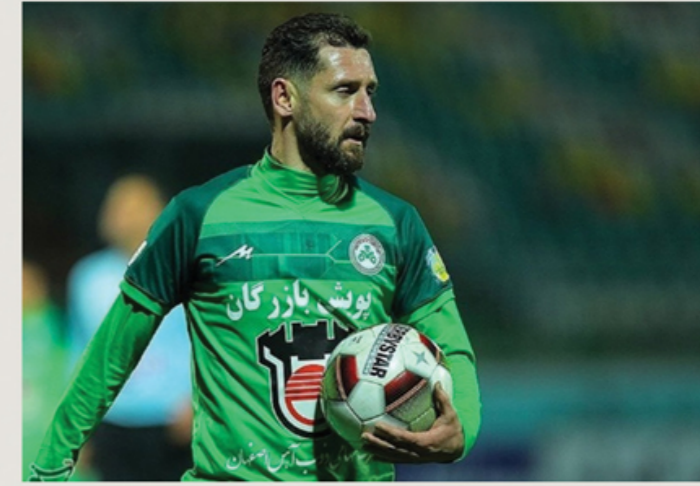
سایت روزنامه نصف جهان