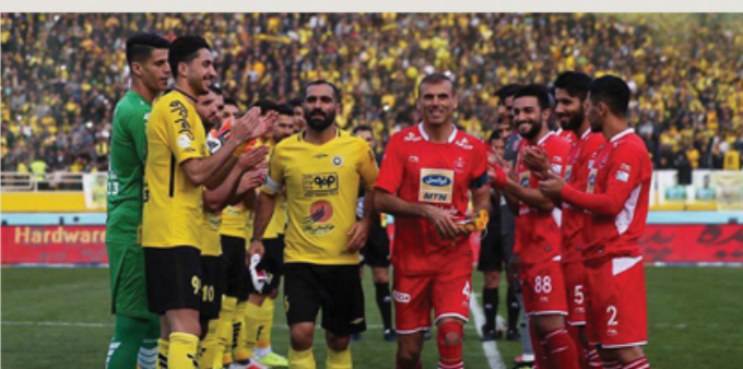
سرخ های ما خواهند دست پیش را بگیرند

از این رو، صدای اعتراض پرسپولیس ها به آسمان بلند شده و آن ها معتقدند این برنامه ریزی سازمان لیگ به ضرر سرخپوشان است. البته هنوز از سوی کمیته مسابقات، زمان برگزاری هفته پنجم اعلام نشده و هیچ کس نمی داند این دیدار در چه تاریخی خواهد بود ولی از حالا، پرسپولیس ها نسبت به برنامه لیگ معترض هستند و به نوعی دست پیش را گرفته اند.