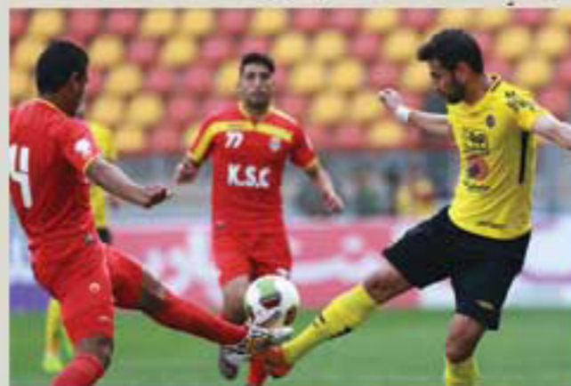
شرح گل ها: