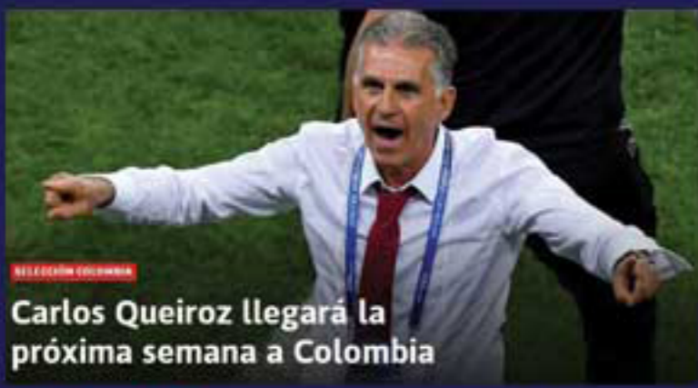
Carlos Queiroz llegará la próxima semana a Colombia