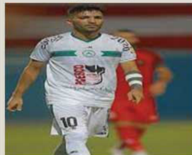
سایت روزنامه نصف جهان

خبری که دیروز سایت های ورزشی منتشر کردند خیلی غیر منتظره نبود و شاید دیر یا زود منتظرش بودیم. محسن مسلمان قرار است خوب آهن را ترک کند.