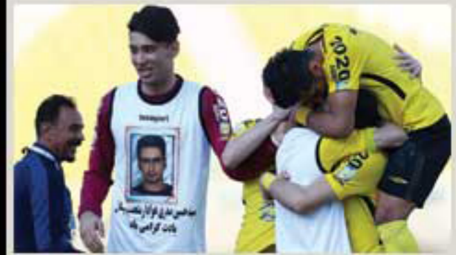
روزنامه نصف جهان

هر چند که صدرنشینی در نیم فصل اول افتخاری محسوب نمی شود ولی تا حدودی تضمین کننده موفقیت یک تیم در پایان فصل است. در ۱۷ دوره گذشته لیگ برتر ۹ بار تیمی که صدرنشین نیم فصل شده در پایان مسابقات قهرمان شده است اما نکته ای که اهمیت این موضوع را بیشتر می کند و سایت برنامه نود هم در گزارشی به آن اذعان داشت، آن است که در ۳ دوره اخیر قهرمان لیگ و صدرنشین نیم فصل اول یک تیم بوده است. هر چند که تاریخ نشان می دهد که صدرنشینی نیم فصل تضمین کننده قهرمانی نیست ولی مرور تاریخ لیگ برتر نشان می دهد که تیمی که در رتبه نخست نیم فصل اول جای داشته در بدترین شرایط در پایان فصل سوم شده است.