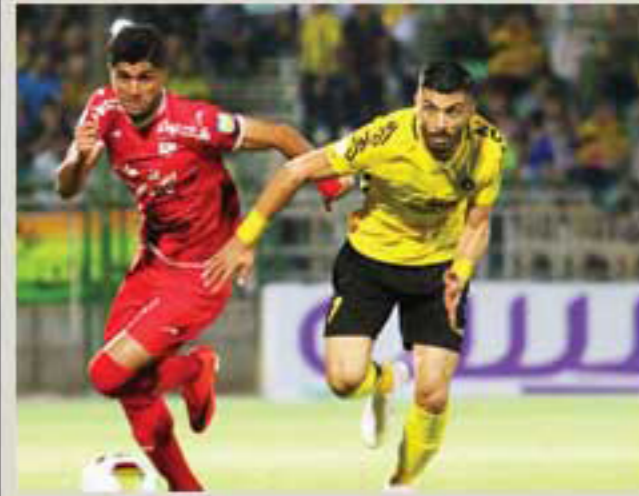
بازیکنان تیم فوتبال سپاهان در فصل هجدهم توانستند، نقش خود را در قالب این تیم به خوبی ایفا کنند.